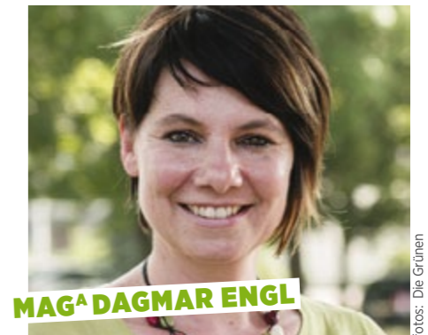
MAG A DAGMAR ENGL